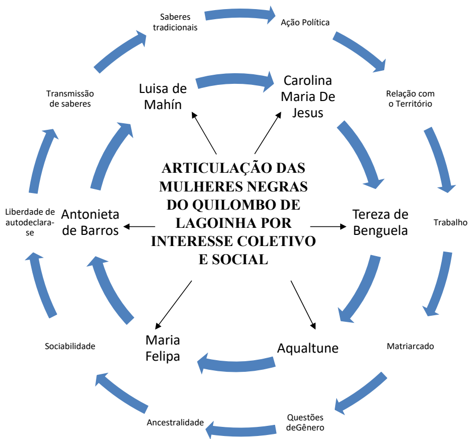
Figura 2 – Articulação das mulheres negras do Quilombo de Lagoinha.